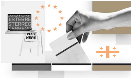
მომზადებულია ორგანიზაცია DRI-ის მიერ