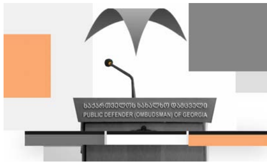
მომზადებულია ორგანიზაცია საფარის მიერ