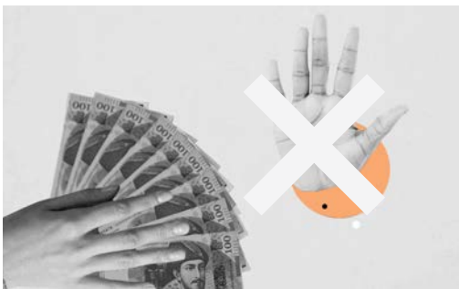
მოზღაბებულია ორგანიზაცია GMC-ის მიერ