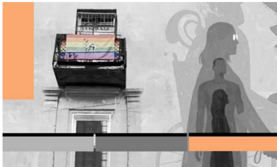
მომზადებულია ორგანიზაცია PHR-ის მიერ